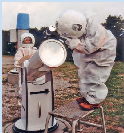
Abb. 5: Astronautentraining für Kids

Die ANTARES-Kids-Gruppe unter der Leitung von Monika Lassinger bietet den Kindern je nach Alter interessante Experimente zum Mitmachen, zum Beispiel ein „Astronautentraining“ (Abb. 5).