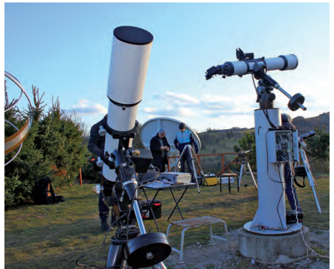
Abb. 3: Meade-Refraktor am Neujahrsmorgen 2011

Als einzige Volkssternwarte in Österreich betreiben wir ein 3 m-Radioteleskop, wobei die Ergebnisse in der professionellen Astronomie im In- und Ausland Beachtung finden.