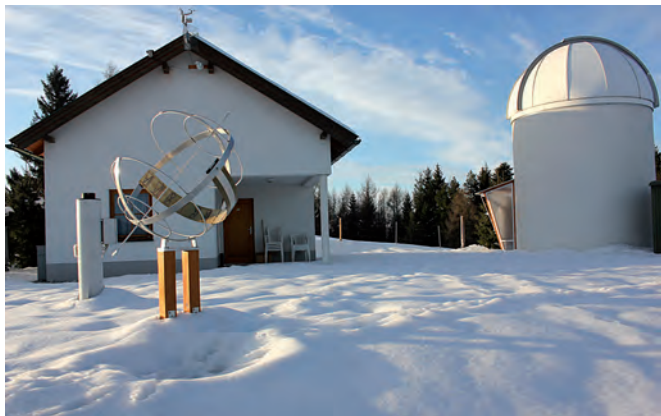
Abb. 1: Sternwarte im November 2010

Der Verein ANTARES (Niederösterreichische Amateurastronomen) bietet seit 1996 seinen Mitgliedern ein attraktives und interessantes Vereinsleben. Er soll allen Mitgliedern und der Öffentlichkeit den Zugang zur Astronomie erleichtern. Dazu wurde die Volkssternwarte in Michelbach südöstlich von St. Pölten errichtet (Abb. 1).