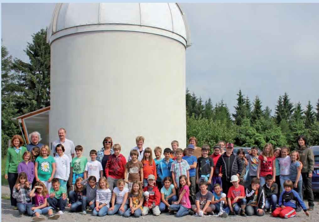
Abb. 4: Schulklassen besuchen gerne die Sternwarte

Astronomie für Kindergartenkinder, Volksschulkinder, Hauptschulkinder und Jugendliche höherer Schulklassen (Abb. 4).