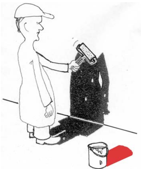
Abb. 1 Stimmt was nicht, an diesem Bild?

Die Reaktion der Klasse hat uns überrascht. Vor allem der rote Schatten des Farbeimers störte die Schüler („rote Schatten gibt es nicht!“). Das war für mich der erste Anstoß, künftig auch farbige Schatten im Unterricht zu behandeln. Noch verblüffender war dann der anschließende Streit in der Klasse, ob denn die dargestellte Überpinselung des Schattens möglich sei oder nicht. Es blieb uns nichts anderes übrig, als unseren Unterricht „nachzubessern“. Wir stellten eine weißbeschichtete Spanplatte vor den Arbeitsprojektor und führten das Experiment durch. Die etwas verschmutzte Fläche wur-