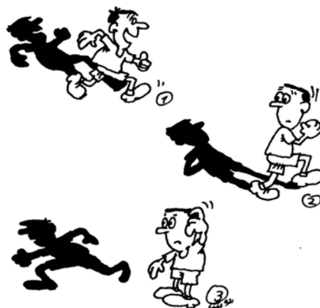
Abb. 2 Zum Widerspruch zwischen Wahrnehmung und wissenschaftlicher Erklärung

Künstler und Literaten nutzen den Widerspruch oft, um unser Denken zu affizieren (Abb. 2), so auch Adalbert v. Chamisso in seinem berühmten Märchen „Peter Schlemihls wundersame Geschichte“,