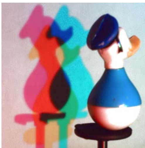
Abb. 4 Aus den Schattenfarben der drei Spotlampen lassen sich die Regeln der Farbaddition gewinnen

Die Spannung zwischen Wahrnehmungsschema und physikalischer Deutung wird noch deutlicher, wenn man die Komplexität durch eine dritte Lampe in der Farbe Blau steigert. Die Farbvielfalt erhöht sich drastisch (Abb. 4). Für die Erklärung muss man die Schattengebiete systematisch unter dem Gesichtspunkt analysieren, welches Licht fehlt, damit es die beobachtete Farbe annimmt. Z. B. erscheint der Schirm dort gelb, wo rotes und grünes Licht hinfällt, aber das Blau fehlt. Im roten Schattengebiet fehlt das Licht der grünen und blauen Lampe usw. Man erhält damit auf einfache