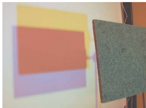
Abb. 6 Das Schatten gebende Brett wurde mit einer grünen und blauen Lampe beleuchtet.

Die Erscheinung ist auf die so genannte Umstimmung des Wahrnehmungsapparates zurück zu führen. Dieser, auch als Farbkonstanz bezeichnete Effekt, sorgt dafür, dass wir die Farben unserer Umgebung weitgehend unabhängig von der spektralen Zusammensetzung der Beleuchtung sehen. Unser Wahrnehmungsapparat führt also ähnlich wie eine Digitalkamera einen Weißabgleich durch. In dem geschilderten Experiment bedeutet dies: Der im Tageslicht weiß erscheinende Schirm wird durch die blaue und grüne Lampe stark cyanfarbig getönt. Um das Weiß zu erhalten, fügt unser Wahrnehmungsapparat die Komplementärfarbe Orangerot dazu. Im Kernschattenbereich bleibt nur dieses künstliche Orange übrig. Der physikalisch grüne Halbschatten erscheint in der additiven Mischfarbe aus Orange und Grün, also gelb und der blaue Halbschatten wird zu Magenta umgestimmt.